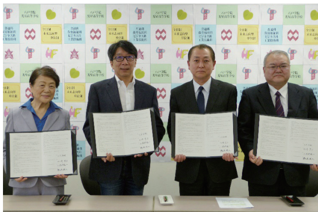
高校・大学・短期大学部連携協定締結

平成30年4月から新たに地域経営学部がスタートする。人口とともに縮小しつつある現代日本は様々な課題に直面し、難しい舵取りが求められる。特に地方は様々な地域課題も併せ持ち、行政はもちろん産業界各事業者も高等教育機関と連携しながら次世代を担うリーダーの育成と地域活性化施策と連動した事業展開が求められている。また、「いのちの世紀」と向かい合う地域医療と福祉を支えるには、より高度な知識と技能を持つ人材も求められる。このような戦後の日本が初めて経験する前例の無い困難な環境の中、我が学校法人は、地域の将来を再考熟慮し、高等教育の再提示として教育改革と併せて人間健康学部とビジネス学部の再編に取り組んできた。その結実として、平成28年度に看護学科を新設した健康医療学部と平成30年度から新たにスタートする地域経営学部の姿がある。両学部はともに、これからの地方の再生創生に不可欠な高度な人材養成の核となる学部である。また系列の八戸学院光星高等学校、八戸学院野辺地西高等学校とは、高校大学連携強化を目的とした協定を締結し、高校の単位制のもと高校時代から短期大学部や大学の授業に参加でき高等教育の学びを先どる事が可能となる取り組みに着手した。八戸学院の上級学校への進学率向上にとどまらず、私学ならではの5年間あるいは7年間かけての理想の教育実現に大いに寄与するであろう。