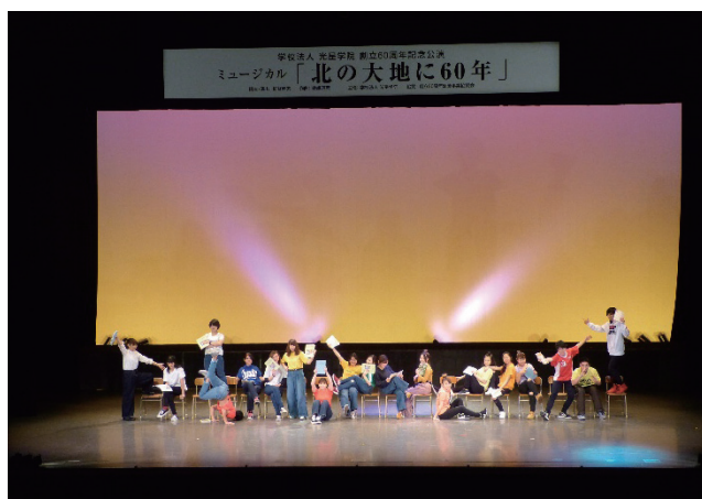
短大ダンス「大変だ」