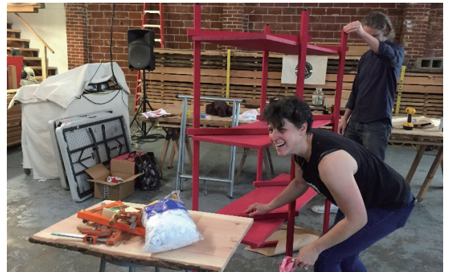
デザイナーのコミュニティ「Hand-Eye Supply」(米国ポートランド市)

米で最も住みたい街」とされる米国ポートランド市の地域ブランドと企業の役割についての研究活動を行っている。また本学2017年度特別研究費を受け、県内では2町村しかない転入超過の町である青森県六戸町において、地域ブランドづくりの取り組みに関する研究活動を行っている。(1)コンテストへの応募 (2)商品開発 (3)パブリシティの獲得 (4)法人営業 (5)展示会への出展といった活動の中には、町民とのワークショップ形式によって意見やアイデアの掘り起こしや、生産者と本学ゼミ生5名とのディスカッションも含まれる。