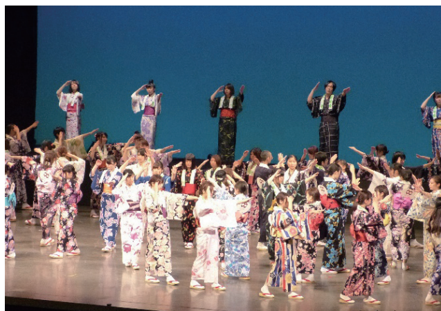
八戸小唄流し踊り