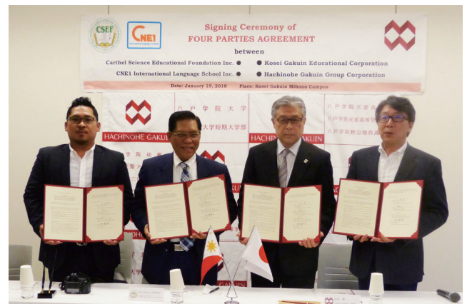
四者連携協定締結